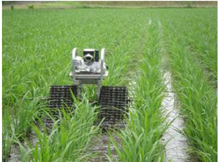
雑草とるぞ！除草ロボット

中津川支所では情報技術研究所と開発を進める小型除草ロボットを使用した水稲の有機栽培技術の実用化に取り組んでいます。昨年度までに深水と有機質肥料の施用により抑草効果が高まることが明らかになりました。今年度は、除草ロボットと有機質肥料表面施用との組み合わせによる抑草効果の確認と、除草ロボットの走行回数を減らしたときの抑草効果について検討しています。支所中間検討会では、参加いただいた皆様に実際に操作を体験していただく準備をしています。是非参加ください。