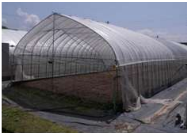
遮光資材を設置した様子

ハウレンソウは涼しい気候を好むため、夏の高温期には収量・品質ともに低下する傾向にあります。そこで、高温対策としてハウスを遮光資材で覆う技術が普及していますが、天候や生育ステージ等に応じた手作業での開閉は労力を要します。そこで当所では、市販のサイドビニール巻き上げ装置を活用し、外張り遮光資材の天候（日射、降雨）に応じた自動開閉管理について検討しています。