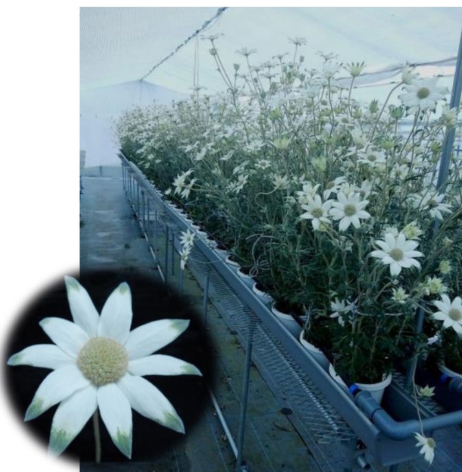
切花用フランネルフラワー品種 “ファンシーマリエ”