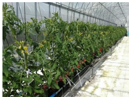
3Sシステムの改良ベンチにおける トマトの生育状況