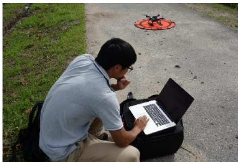
ドローンを用いた食味調査 (岐阜大学との連携)