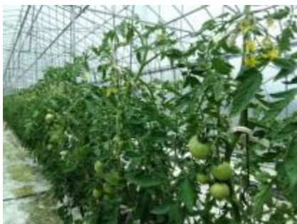
育苗期の管理が初期果実品質に及ぼす影響を確認中

まず、育苗期の肥培管理が苗質や低段の果実肥大に及ぼす影響、収量、品質に及ぼす影響を調査し、5年後には育苗管理マニュアルを完成します。