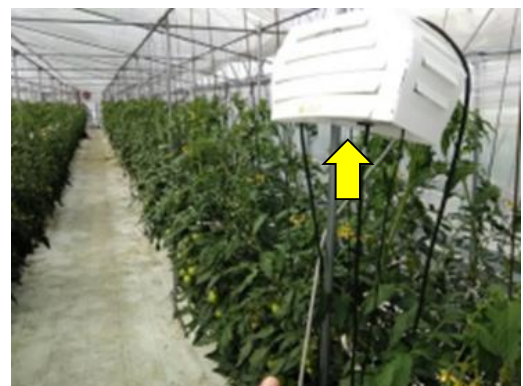
環境モニタリング機器 (温度・湿度・CO 2 などを測定)

※「3Sシステム」 Small amount Separated cultivate-system for Soranaceae ＝ナス科果菜類隔離型少量培地耕システム