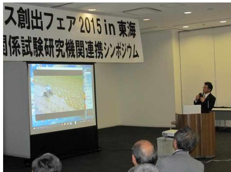
動画も交えた発表